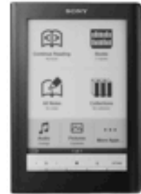
PRS 600 de Sony